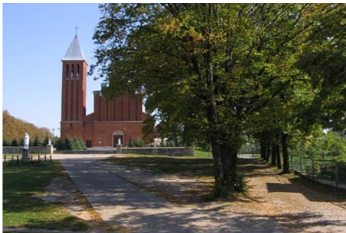
...i nowy Kościół w Wolanowie.