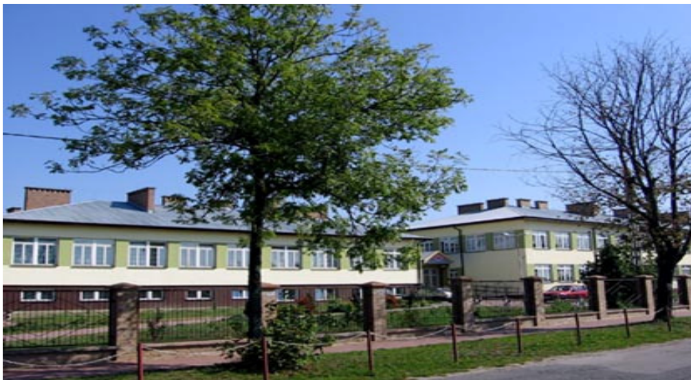
Zespół Szkół Ogólnokształcących w Wolanowie

Od 2003 roku w Zespole Szkół Ogólnokształcących w Wolanowie funkcjonuje również Niepubliczne Zaoczne Liceum Ogólnokształcące dla Dorosłych.