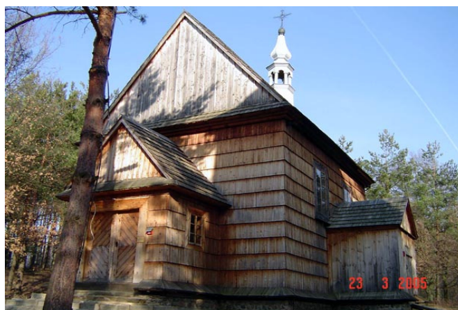
Drewniany zabytkowy Kościół...