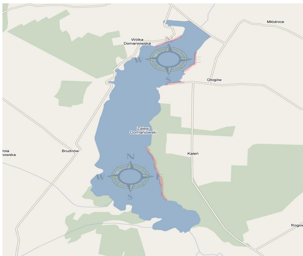
Zalew w Domanowie