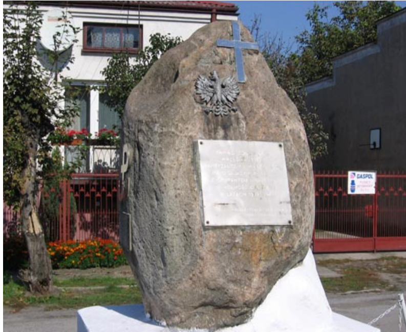
Pomnik poświęcony poległym w czasie II wojny światowej