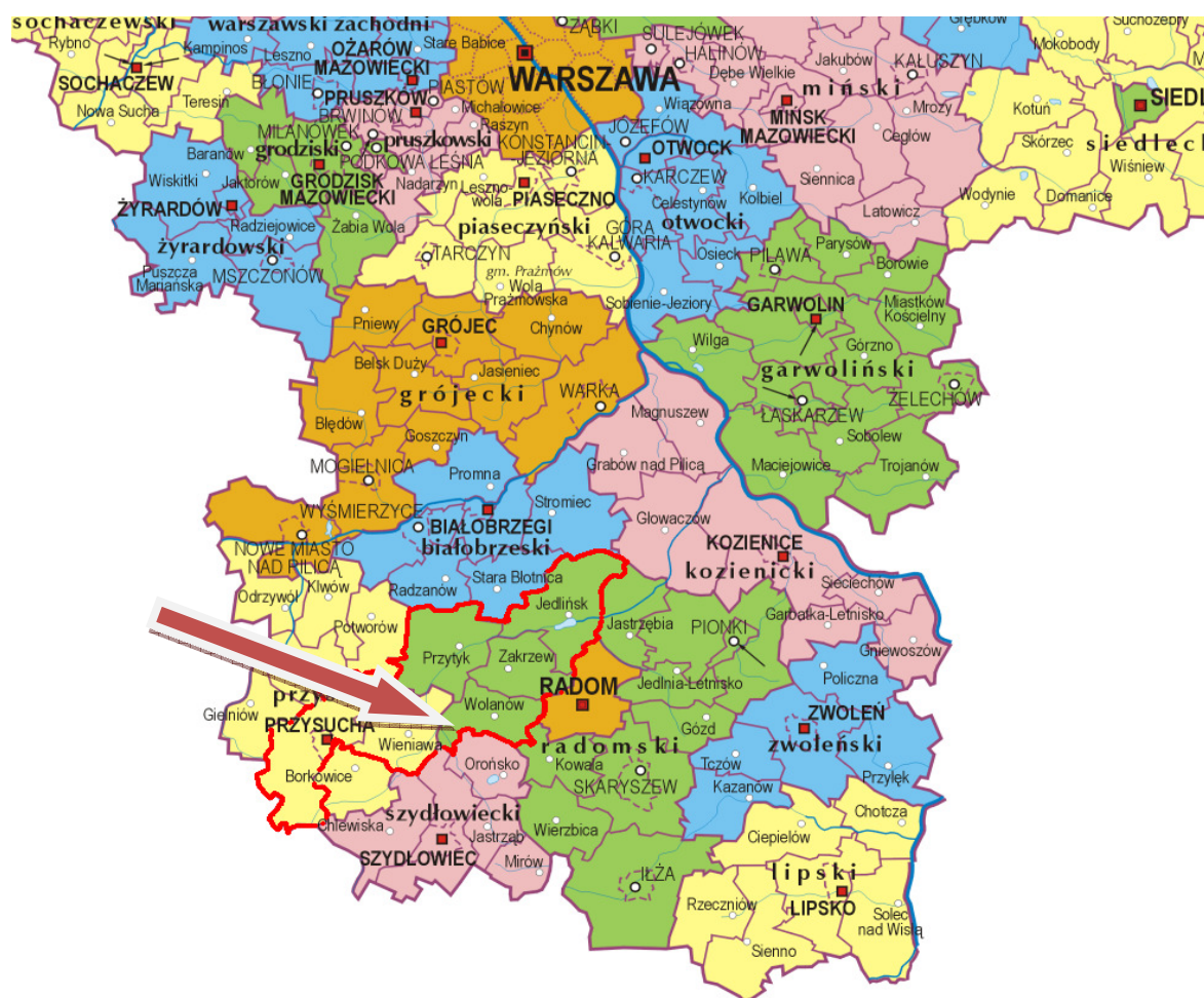
Mapka 1. Położenie Gminy Wolanów w woj. Mazowieckim