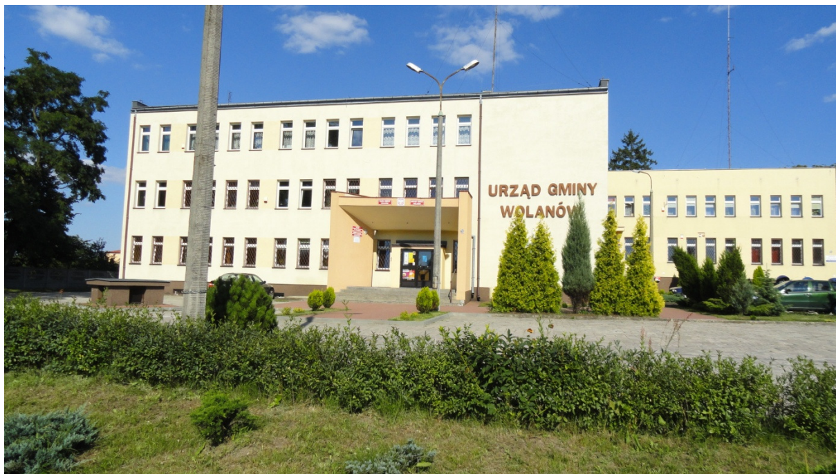
Urząd Gminy w Wolanowie